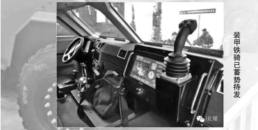
装甲铁骑已蓄势待发