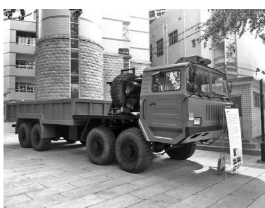
近距离围观正在03大阅兵的军车