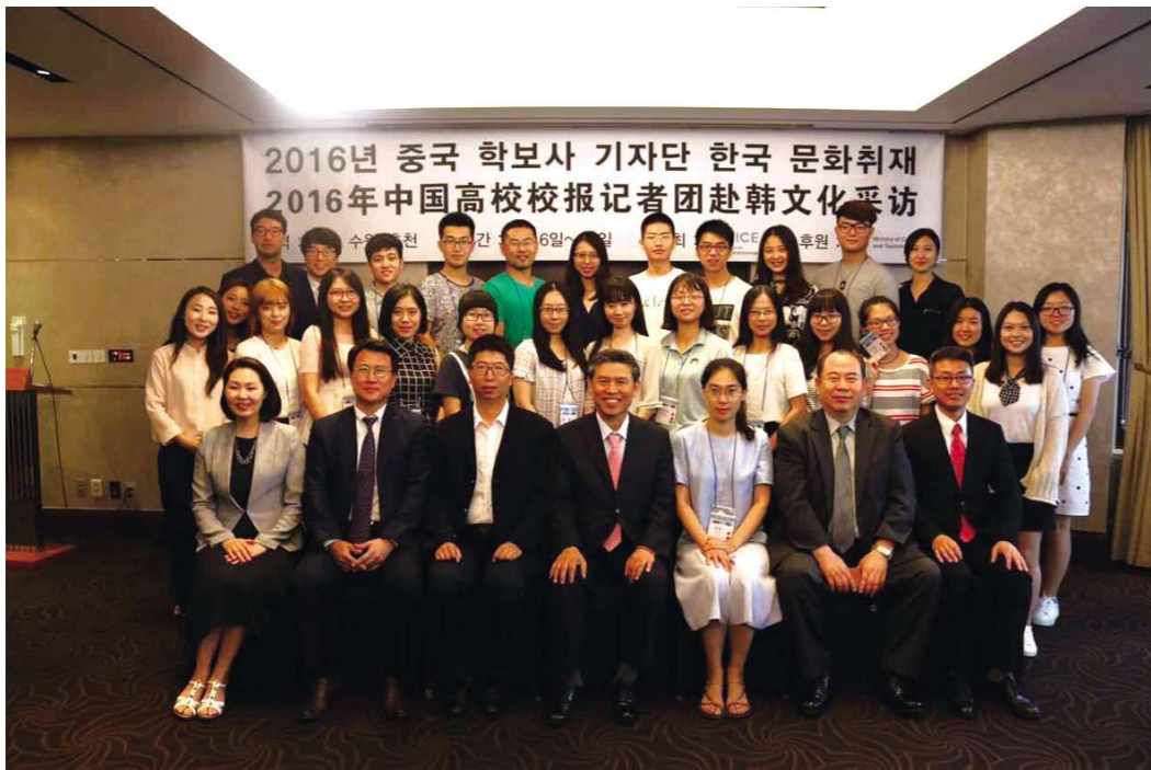
2016년 중국 학보사 기자단 한국 문화취재 2016年中国高校校报记者团赴韩文化采访

兜兜转转二十余年,穿梭于各地名山大川,每到一处,便会用眼、用脑、用心去感受各异的风土人情、文化传统,时而乐以天下,时而悲喜交加,时而手舞足蹈,时而怒放心花。尽管众览美景,却因多年钟情于韩流综艺而对韩国这个半岛国家充满了好奇与期待,距离之近似乎随时可以完成心愿,但却因各种因素将行程一拖再拖,始终无法一探究竟。2015年订好的行程因 MERS 肆虐而被迫取消,今年得知再去的消息,顿时喜上眉梢,终于踏上这美妙的旅途。