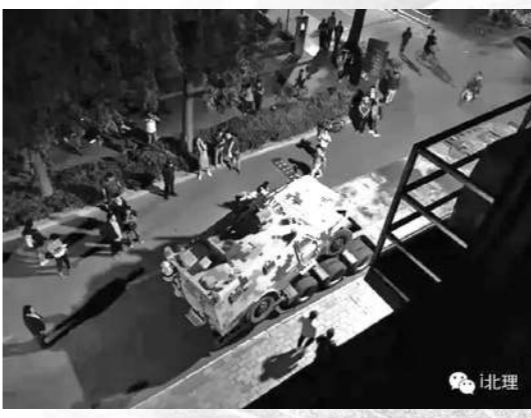
「校车是这样进本部的