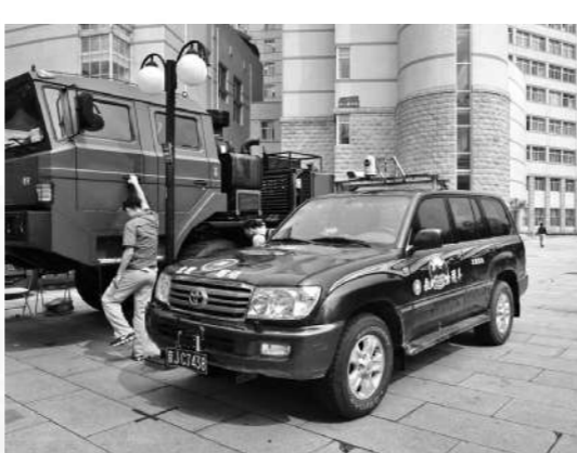
我校研发的无人驾驶和智能控制系统