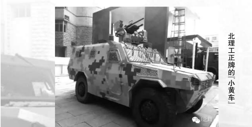
北理工正牌的「小黄车」

特种车、北齿、陕西法士特、河北华柴、潍柴动力和北京理工大学等单位,VN4型轮式装甲车、猛士防护型突击车等16款越野车以及军用柴油发动机、防爆轮胎等多种技术装备,吸引了众多校友和校内外各界人士的参观。